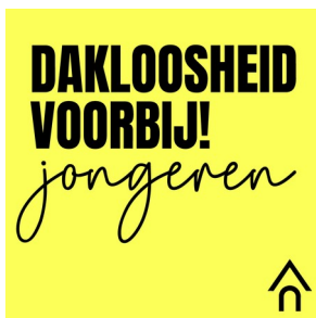
Dakloosheid Voorbij! Jongeren