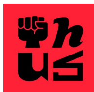
HUS (Den Haag)